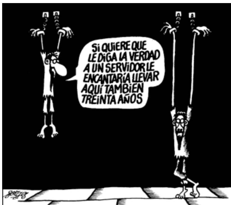
Forges. Lo mejor de Por Favor, Punch Ediciones

Sobre l'extensió, mètodes, estadístiques, tractats de prevenció, etc. us remetem, com dèiem, als informes d'A.I. esmentats abans.